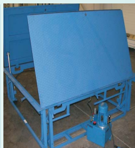
Botola automatica di chiusura Modello Palio

Diagramma di selezione del modello in funzione del Carico Nominale (Q) e la Superficie .utile di carico (S). La superficie massima viene limitata a 200 kg/m e per il massimo costruttivo di A e B per ogni modello.