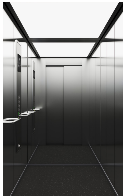
New Supra Acciaio Inox