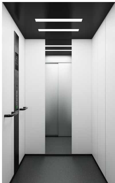
New Viliter Lamiera plastificata

Ora devi solo selezionare lo stile della cabina e progettartela. Puoi scegliere tra numerose finiture e combinarle come preferisci.