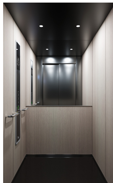
New Style Melamina | Compensato laminato